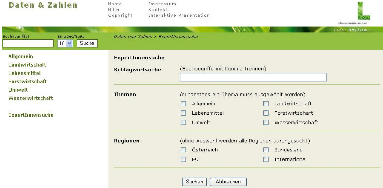
Abbildung 12 - ExpertInnensuche

Die ExpertInnensuche bietet umfangreiche Möglichkeiten aus dem großen Angebot an Tabellen von Daten und Zahlen die gewünschten zu filtern.