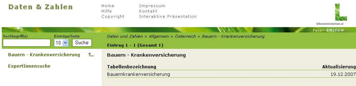
Abbildung 9 – Contentbereich

Im Contentbereich (rechter Frame grau hinterlegt) wird die aktuell ausgewählte Kategorie angezeigt. Weiters werden hier sämtliche Tabellen, welche dieser Kategorie zugeordnet sind, aufgelistet. Zu jeder Tabelle werden der Name und das Datum der Aktualisierung angezeigt.