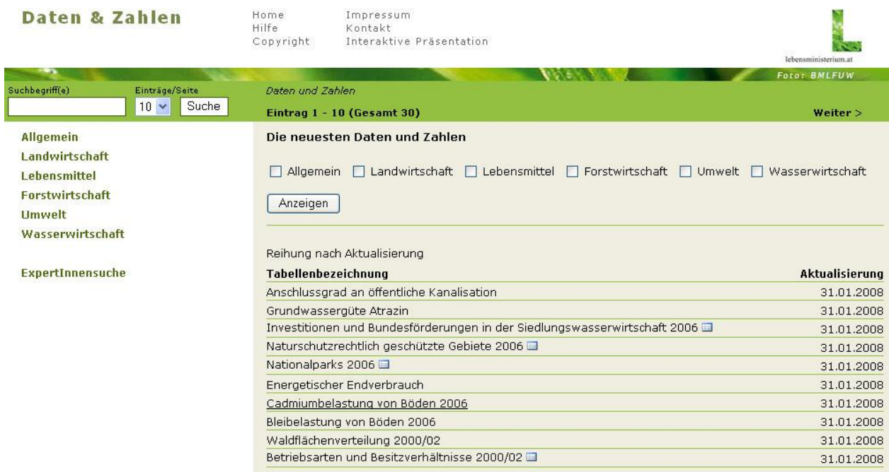
Abbildung 1 - Startseite

Auf der Startseite werden die 5 aktuellsten Tabellen jeder Kategorie angezeigt. Maximal 10 Tabellen pro Seite. Mit Hilfe des Links „weiter“ werden die weiteren Tabellen angezeigt. Nach der Auswahl einer Kategorie z.B.: Landwirtschaft werden die aktuellsten 5 Tabellen der ausgewählten Kategorie angezeigt.