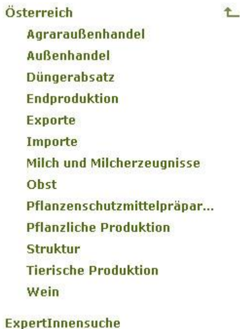
Abbildung 6 - Navigation Unterseite 2

Über die Navigation ist es möglich, gezielt Tabellen zu einem bestimmten Themengebiet zu finden. Wenn die BenutzerIn eine Unterkategorie ausgewählt hat, werden darunter liegende Kategorien eingerückt angezeigt (vgl. Abb. 5). Um wieder auf eine höhere Ebene zu wechseln, kann der Pfeil (vgl. Abb. 5) verwendet werden.