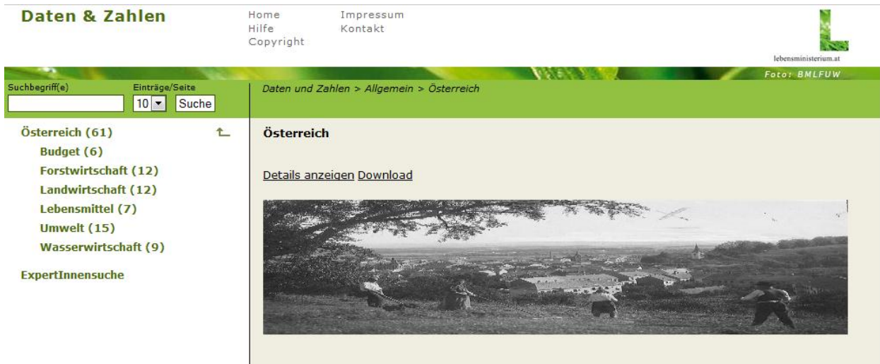
Abbildung 8 – Contentbereich – Österreich, Bundesland, EU, International

Durch Klick auf dem Link „Details anzeigen“ wird in einem externen Browserfenster das Detail-Bild angezeigt. Ist kein Detail-Bild vorhanden, so ist dieser Link nicht sichtbar.